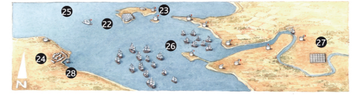
La rade du port de Rochefort et ses défenses : Fort Boyard 22 dont la mission était d'empêcher les vaisseaux ennemis de pénétrer dans la rade ; en effet, les canons des îles d'Aix 23 et d'Oléron 24 ne pouvaient alors atteindre le milieu du pertuis d'Antioche 25. Flotte Française 26. Arsenal de Rochefort 27. Boyardville 28.

... Pour 28 ans : en 1837, une commission constate que l'enrochement ne s'est enfoncé que d'un mètre et qu'il semble stabilisé. La France est en paix et s'enrichit, le ministère de la Marine voit grand et un nouveau projet, plus imposant, est approuvé en 1841. Pour l'assise, elle sera constituée d'alvéoles de ciment remplies de chaux 6, le tout entouré d'une « risberme » 7, une bordure assez large elle-même protégée par des blocs de 15 m 3 8. Le chantier, minutieusement organisé, commence en 1842 et bénéficie d'une main-d'œuvre locale abondante. « Les habitants d'Oléron semblent prendre intérêt, maintenant, à la construction de ce fort, note le préfet maritime en 1843, de telle manière qu'au moment de la marée, on trouve facilement des manœuvres habitués pour la plupart à courir sur les rochers et à ne pas craindre de se mettre à l'eau ». Les ingénieurs