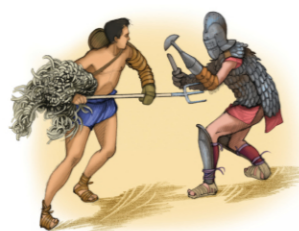
Rétiaire (à gauche) et scissor

quelque chose à la fois du match de Ligue 1, du meeting électoral, du concert de rock et de la soirée de catch, il leur faut attendre jusqu'en début d'après-midi avant de voir leurs champions. Pour les faire patienter, une belle procession le matin marque l'ouverture des jeux, la «pompa». Puis, quand tout le monde est bien installé sur les gradins, les «venationes», des spectacles avec animaux. À midi, pendant qu'on entre et on sort pour se rafraîchir et se restaurer : exécutions des condamnés, mises en scène de façon pittoresque ou mythologique. Enfin arrivent les gladiateurs, qui vont faire vibrer l'amphithéâtre tout au long de l'après-midi, au milieu des cris et des râles.